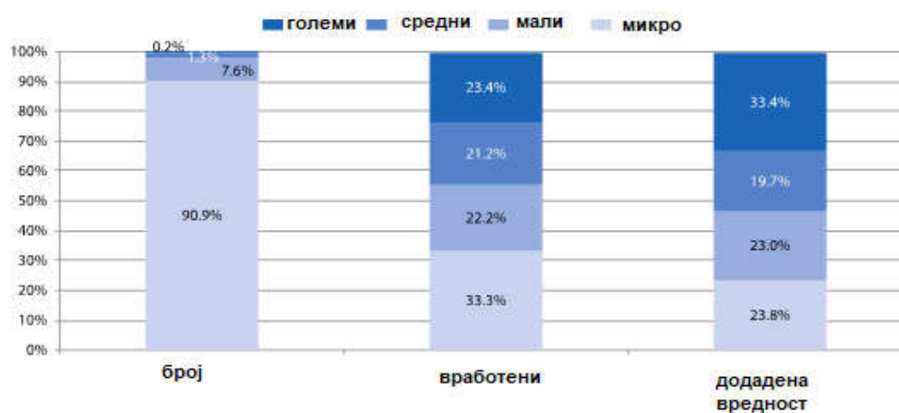
Слика 2: Показатели за демографијата на претпријатијата